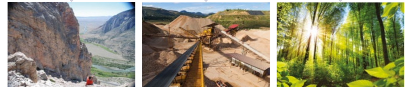
Panorama de la formation Madison au canyon de Clark's Forks River