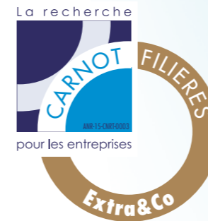
Illustration : S. Badji